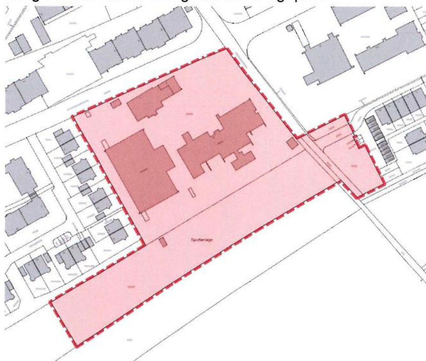
Abbildung: Lageplan des Geltungsbereichs des Bebauungsplanes mit Grünordnungsplan Nr. 110 „Gemeindezentrum Eglharting“ (nicht maßstäblich)

Der exakte räumliche Geltungsbereich des Bebauungsplanes mit Grünordnungsplan Nr. 110 „Gemeindezentrum Eglharting“ ergibt sich aus der rot dargestellten Umgrenzung im nachstehend abgebildeten Lageplan: