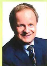
Ihr Landrat Robert Niedergesäß

Ob Sie nun selbst eine Tätigkeit als Tagesmutter/-vater ins Auge fassen oder Interesse an der Vermittlung einer Kindertagespflegestelle haben - ich würde mich freuen, wenn Sie unser vorliegendes Angebot in Anspruch nehmen würden. Anlaufstelle ist die Fachberatung Kindertagespflege im Kreisjugendamt, die Sie gerne berät.