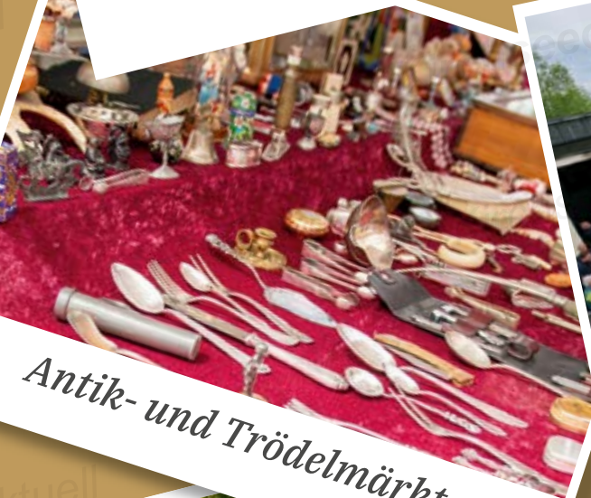
Antik- und Trödelmärkte