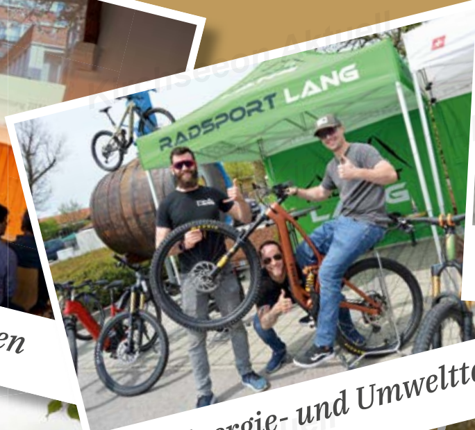
Energie- und Umwelttag