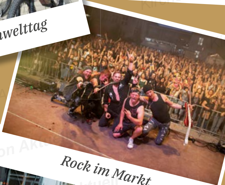
Rock im Markt