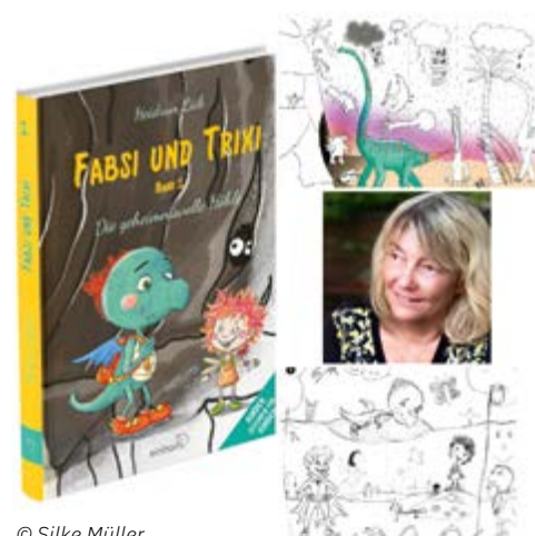
© Silke Müller über die Teilnahme beider Schulen aus Kirchseeon.

Und der Höhenflug geht weiter! Im Frühjahr 2024 wird der 2. Band „Fabsi und Trixi – Die wilden Piraten“ herauskommen. Diesmal wirken neben dem Ebersberger viele weitere bayerische Landkreise mit und sogar andere Bundesländer werden vertreten sein. Besonders stolz ist man über die Beteiligung aus Berlin, Hamburg und Leipzig. Sehr erfreut ist Heidrun Lick zudem