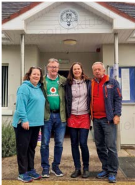
Der örtliche Tennisclub war ebenfalls einen Besuch wert.