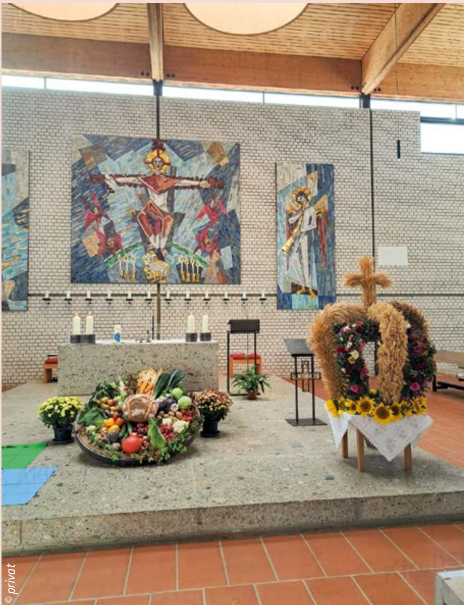
Danke für die reiche Ernte: Das prallvolle Ernterad mit verziertem Brot, Mais, Lauch, Kohl, Kürbis und anderem Gemüse und Obst sowie die festlich geschmückte Erntekrone aus Getreide, bunten Dahlien und leuchtenden Sonnenblumen beim Festgottesdienst in der Erlöserkirche Eglharting.