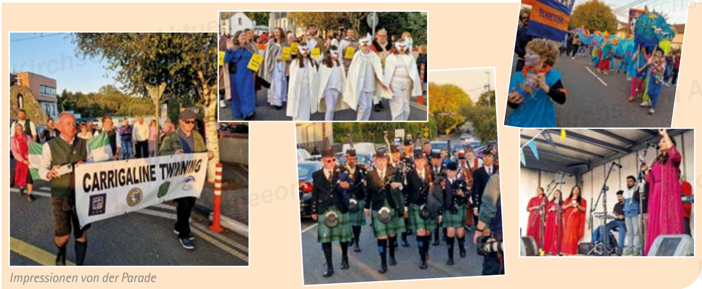
Impressionen von der Parade

Der Samstag war geprägt von vielen Besuchen bei Vereinen, um die Partnerschaft mit neuen Gesichtern zu beleben.