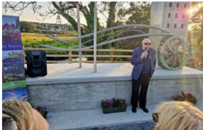
Der Verein „Tidy Towns“ enthüllte eine Skulptur über die „Carrigaline Milling Industry“.

In Carrigaline fand ab 17 Uhr eine ganz besondere Veranstaltung „Culture evening/night in Carrigaline“ statt. Bei diesem Event zeigten sich sehr vielen Vereine, Institutionen und Kinder von ihrer kulturellen Seite.