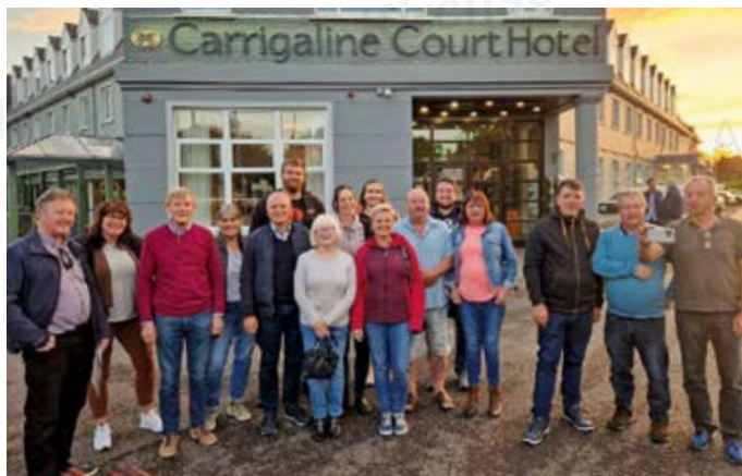
Meet & Greet

Am 21.10.2023 wurden wir sehr herzlich und mit großer Freude bei einem Meet & Greet im Carrigaline Court Hotel empfangen, schließlich war der letzte Besuch in Carrigaline 2019 mit einer Gruppe der Perchten.