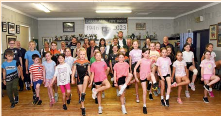
Schülerinnen und Schüler bei einer Probe für irischen Volkstanz

Am Ende des Umzuges gab es ein großes Treffen auf einem Parkplatz, wo sich verschiedenste Musikgruppen präsentierten. Bei herrlichem Wetter war die „Carrigaline Culture Night“ ein voller Erfolg.