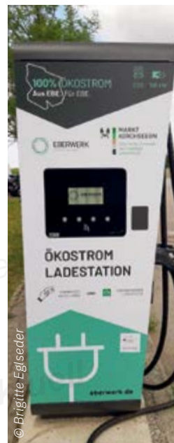
Ladesäule Autohaus Schlöffel Eglharting