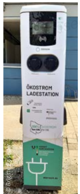
Ladesäule Bahnhof Kirchseeon